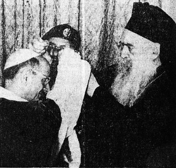
Η συνάντησις Παπα και Πατριάρχου