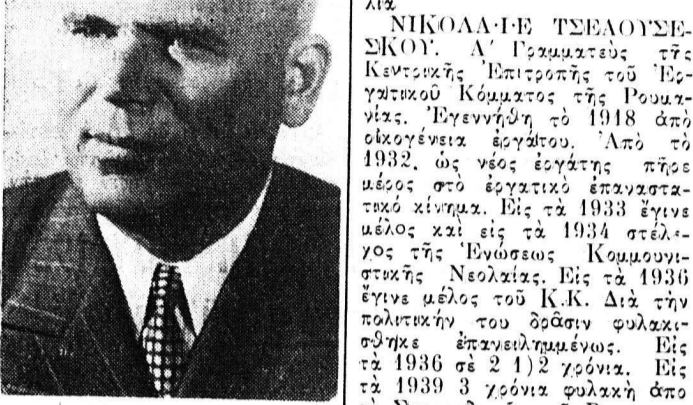
ΚΙΒΟΥ ΣΤΟ-Ι-ΚΑ πρόεδρος της Λαϊκής Δημοκρατίας της Ρουμανίας