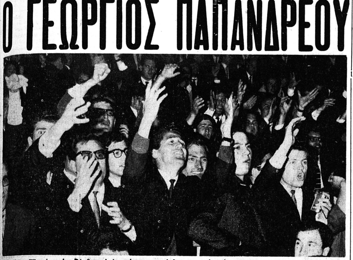
Ος Πατέρα υπεδέχθη με απεριγράπτον ένθουσασμόν τόν Γεώργιον Παπανδρέου ή δημοκρατική νεολαία Β. Ελλάδος