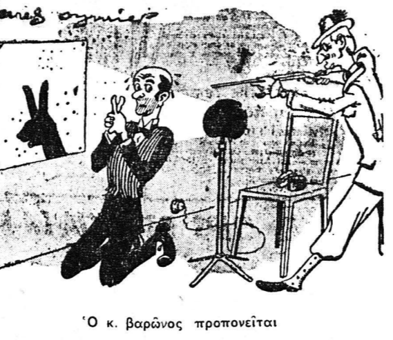
Ο κ. βαρώνος προπονείται

ΚΑΡΤ - ΠΟΣΤΑΛ ΠΑΣΧΑΛΙΝΑ ΕΥΡΩΠΑΙΚΑ ΚΑΙ ΕΓΧΩΡΙΑ ΒΙΒΛΙΟΠΩΛΕΙΟΝ Ε. Χ. ΓΑΛΑΝΗ ΚΟΛΟΚΟΤΡΩΝΗ 34 ΤΗΛ. 23-24 (ΕΝΑΝΤΙ ΤΑΧΥΔΡΟΜΕΙΟΥ) ΠΑΤΡΑΙ