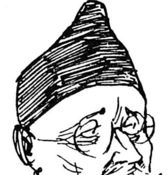
Επιτοχίον. Μη γίνεσθε άρριβισταί.