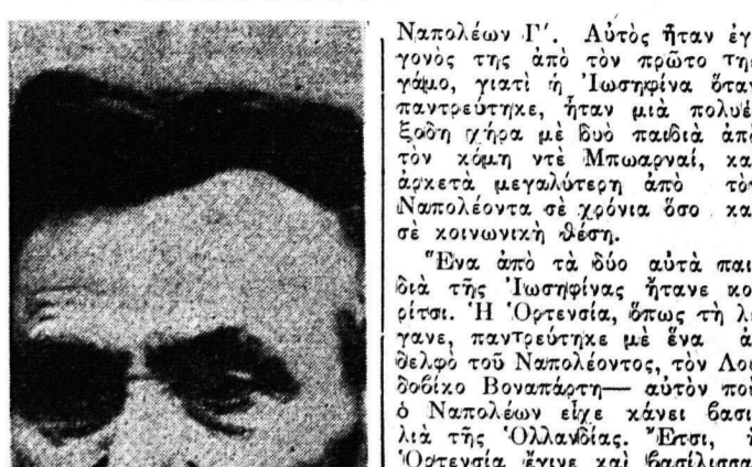
Ναπολέων Ι'. Αυτός ήταν ο γόνος της από τον πρώτο της γένους...