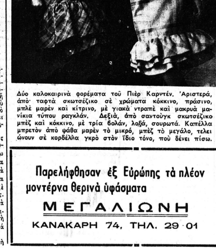
Χαριτωμένο παλτό «αντιμετωπίζοντας» τον Πιέρ Καρντέν...