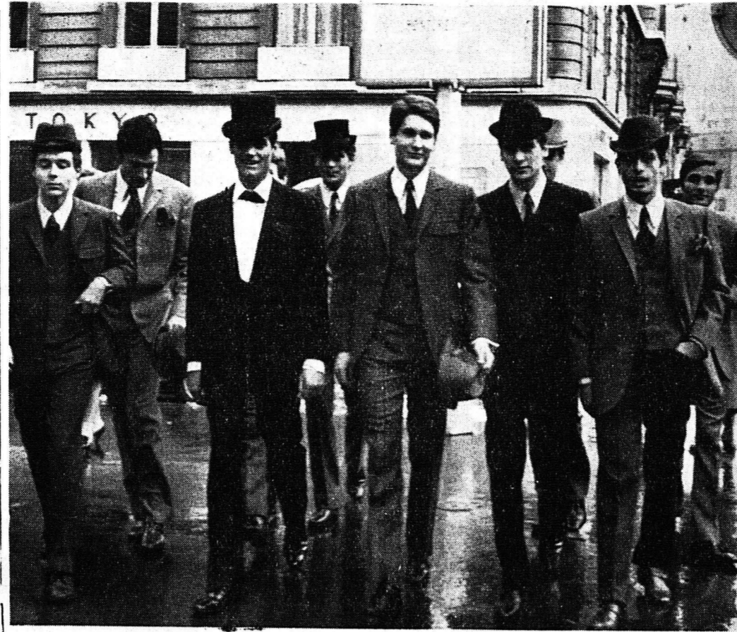
Μία ομάδα νεαρών κατ' εντέλειαν της μόδας Πιέρ Καρντέν