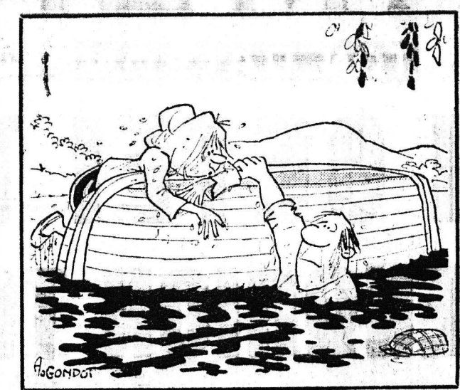
— Τρέχουμε. Δεν τρέχουμε! —

ΣΑΒΒΑΤΟ 17 ΙΟΥΛΙΟΥ Παράλθον 199 ήμέρας Υπελείπονται 167 Σελήνη 20 ήμέραν Ανατολή 6.15 Δύσις 8.47 Μαρίνης μεγαλομάρτυρος