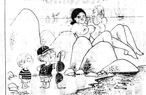
Ανάλογα με το περιεχόμενο δεν θναίνονται...

Η ΜΝΗΜΗ ΣΑΜΟΥΗΛ ΤΟΥ ΠΡΟΗΓΟΥ... (Article about the memory of Samuel the Prophet)