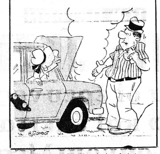
Η μηχανή είναι και μέγα. Διψάει!