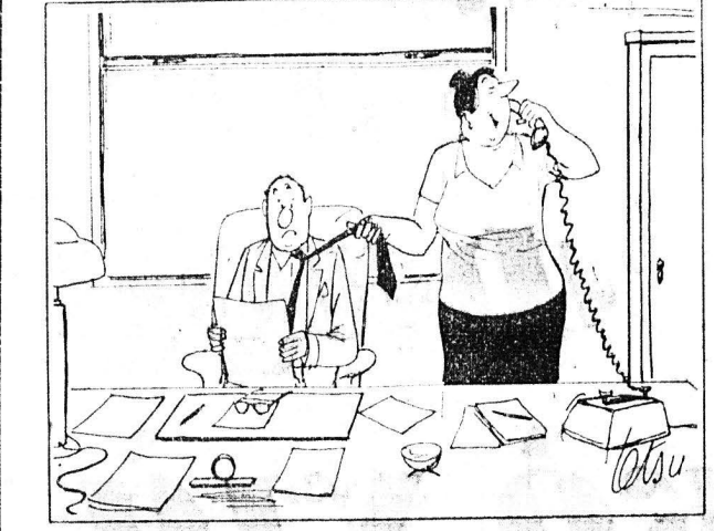
—Του υπενθύμινα το ραντεβού σας, δεσποινίς και να είδαθε θα είχα... (Απόφαση...)

Περίωνυμες γυναίκες της ιστορίας... (Η Σοφία-Βαρβάρη του Τσελλε...)