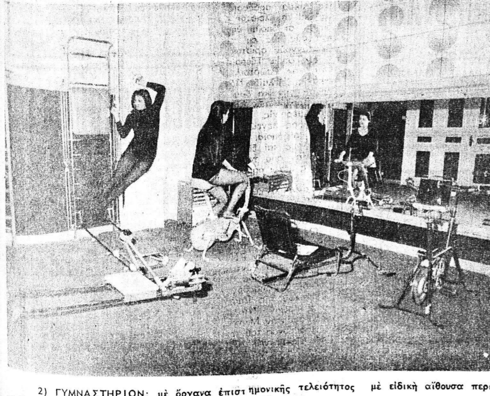
2) ΓΥΜΝΑΣΤΗΡΙΟΝ: με ὄργανα ἐπιστημονικῆς τελειότητος με εἰδικὴ αἴθουσα περι- ποιήσεως σώματος με ἐλεγχόμενη ΣΑΟΥΝΑ.