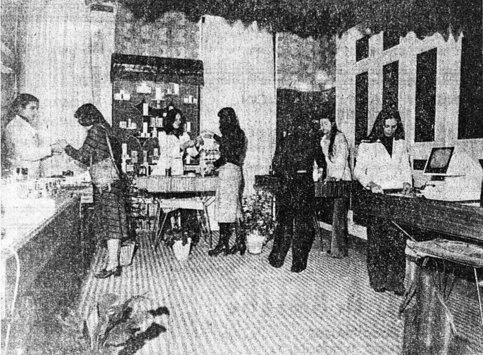
5) ΚΑΛΥΝΤΙΚΑ: με τὶς πλέον ἀνεγνωρισμένες δ'εθνῶν φήμιες σὲ τιμῆς συμφέρουσας, με ὑπεύθυνους αισθητικῶς πωλητῆς, με γνήσια σὲτ Avon Ludia, Dainow woodbury, Lancome Lang- ster georgés Helena Rubinstein, Payot, Sarko Mary Moor arval coruso salome