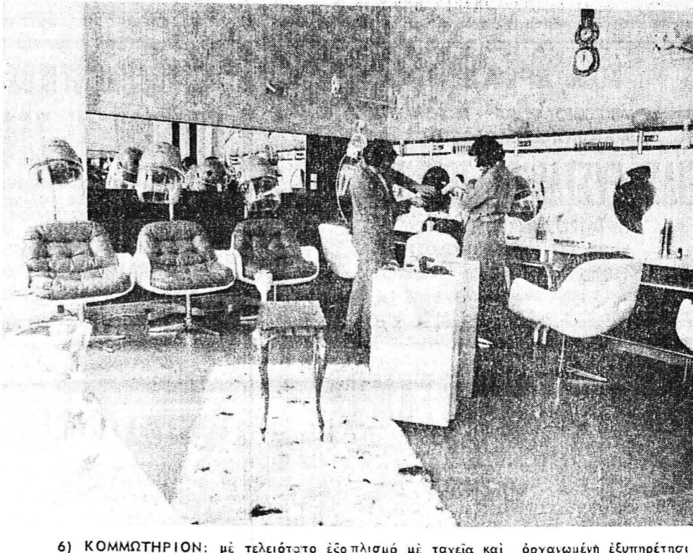
6) ΚΟΜΜΩΤΗΡΙΟΝ: με τειοτάτο ἐξοπλισμὸ με τοχεῖα καὶ ὁργανωμένη ἐξυπηρέτησι με καταπληκτικῆς κομμώσεως.