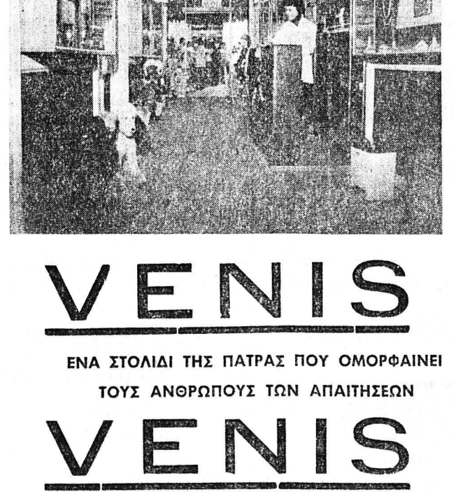
6) ΚΟΜΜΩΤΗΡΙΟΝ: με τελειότατο έξοπλισμό με ταχεία και όργανωμένη εξυπηρέτησι με καταπληκτικές κομμώσεις.