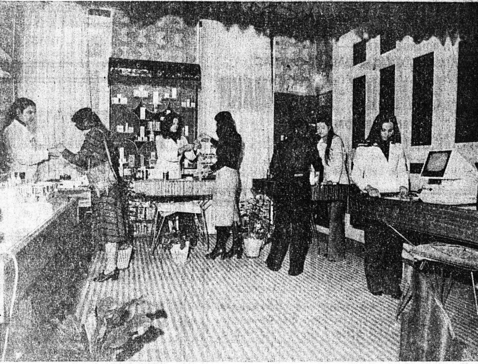
5) ΚΑΛΛΥΝΤΙΚΑ: με τις πλέον άνευγιρισμένες διεθνώς φίρμες σε τιμές συμφέρουτες, με υπεύθυνους αισθητικούς πωλητές, με γνήσια από Avon Ludia, Dainow woodbury, Lancome Langs.