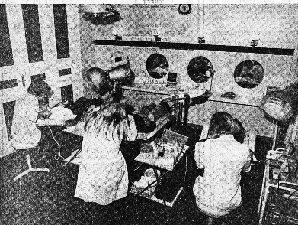
1) ΙΝΣΤΙΤΟΥΤΟ ΔΙΣΘΗΤΙΚΗΣ με τὰ πιδ σύγχρονα καὶ ἀποτελεσματικὰ μηχανήματα με ἐπιστημονικὸ καὶ εἰδικευμένον προσωπικόν.