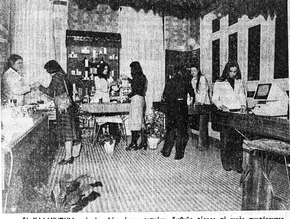
5) ΚΑΛΥΝΤΙΚΑ: με τῆς πλέον ἀνεγῶρισμένες διεθνῶς φήμες σὲ τιμῆς συμφέρουσας, με ὑπεύθυνους αἰσθητικῶς πωλητῆς, με γνήσια σὲτ Avon Luda, Dainow woodbury, Lancome Langoster georgés Helena Rubinstein, Payot, Sarko Mary Moor arval course salome