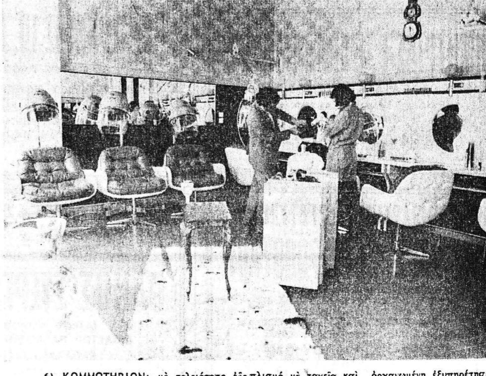
6) ΚΟΜΜΩΤΗΡΙΟΝ: με τελειότατο έξοπλισμό με ταχεία και όργανωμένη έξυπνήτεια με καταπληκτικές κομμώσεις.