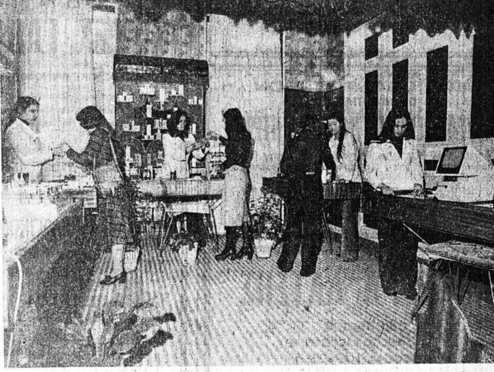
5) ΚΑΛΥΝΤΙΚΑ: με τις πλέον άνεγνο ρισμένες διεθνώς φίρμες σε τιμές συμφέρουσες με όπευθύνους αισθητικούς πωλητές, με γνήσια σέτ Avon Lulia, Dainow woodbury, Lancome Langster georgés Helena Rubinstein, Payot, Sarko Mary Moor arval coruse salome

VENIS ΕΝΑ ΣΤΟΛΙΔΙ ΤΗΣ ΠΑΤΡΑΣ ΠΟΥ ΟΜΟΡΦΑΙΝΕΙ ΤΟΥΣ ΑΝΘΡΩΠΟΥΣ ΤΩΝ ΑΠΑΙΤΗΣΕΩΝ VENIS ΓΙΑ ΟΙΟΥΣ ΘΕΛΟΥΝ ΝΑ ΕΧΩΡΙΣΟΥΝ ΤΗΛΕΦΩΝΑ 277.485. 272.354