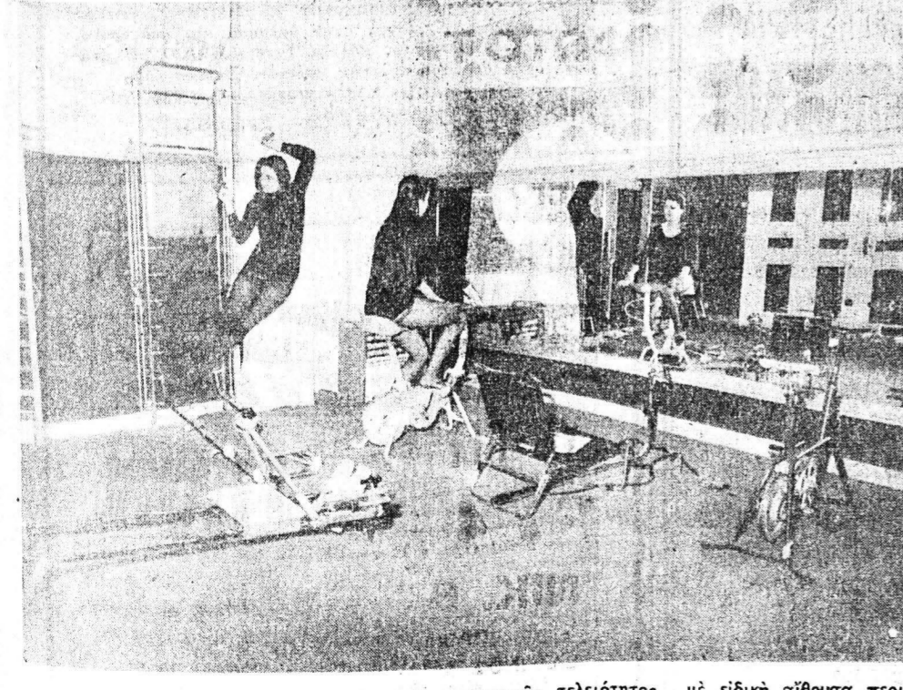
2) ΓΥΜΝΑΣΤΗΡΙΟΝ: με όργανα έπιστημονικής τελειότητος με ειδική αίθουσα περιποίησης σώματος με έλεγχόμενη ΣΑΟΥΝΑ.