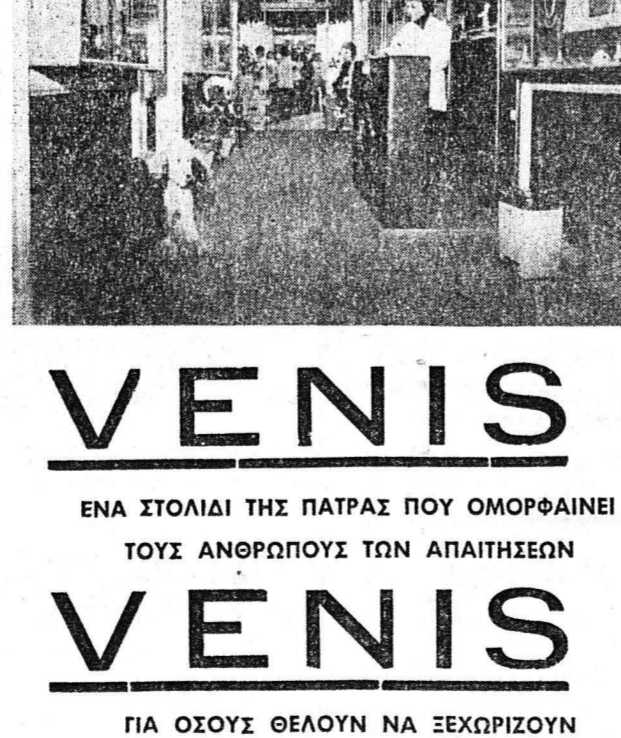
6) ΚΟΜΜΩΤΗΡΙΟΝ: μὲ τελειότατο ἐξοπλισμὸ μὲ ταχέια καὶ ὀργανωμένη ἐξυπηρέτησι μὲ καταπληκτικὰς κομμώσεις.

VENIS ΕΝΑ ΣΤΟΛΙΔΙ ΤΗΣ ΠΑΤΡΑΣ ΠΟΥ ΟΜΟΡΦΑΙΝΕΙ ΤΟΥΣ ΑΝΘΡΩΠΟΥΣ ΤΩΝ ΑΠΑΙΤΗΣΕΩΝ VENIS ΓΙΑ ΟΣΟΥΣ ΘΕΛΟΥΝ ΝΑ ΞΕΧΩΡΙΖΟΥΝ ΤΗΛΕΦΩΝΑ 277.485, 272.354