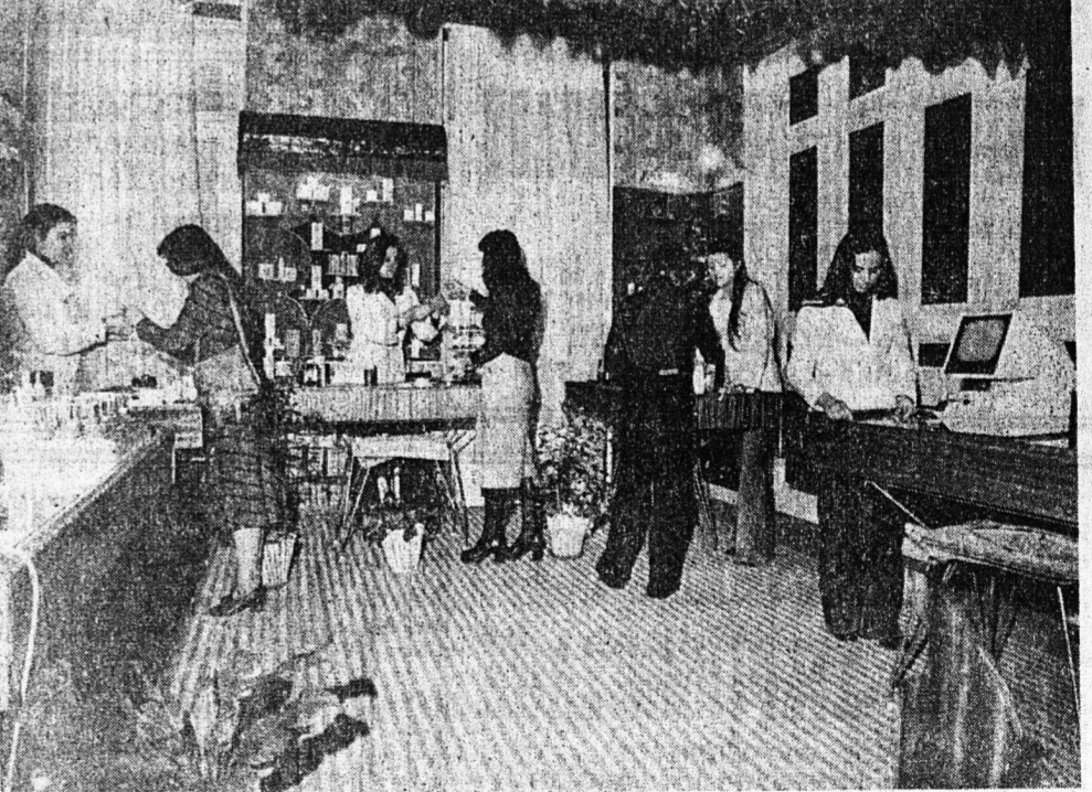
5) ΚΑΛΥΝΤΙΚΑ: μὲ τίς πλέον ἀνεγνωρισμένους διεθνῶς φήμιες σὲ τίμεις συμφέρουσες μὲ ὑπευθύνους αισθητικῶν πωλητῶν, μὲ γνήσια σὲτ Avon Luda, Dainow woodbury, Lancome Langster georgis Helena Rubinstein, Payot, Sarko Mary Moor arval coruse salome