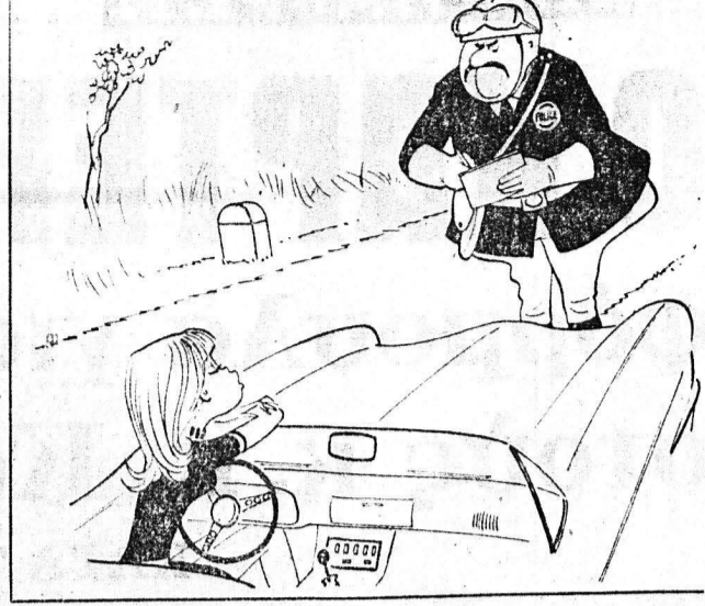
—Να χάρις το μουστάκι σου, κύριε πόλισην, μή με γράφεις!