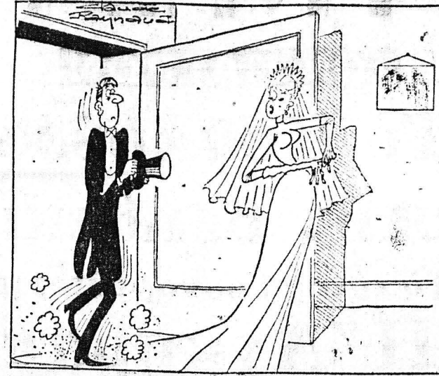
—'Εν πρώτοις, να ακουήζεις τα πόδια σου! Δεύτερον να...

Η ΗΜΕΡΑ ΤΩΝ ΠΑΤΡΩΝ — 'Ιδιότητες ANNA ΧΡ. ΡΙΖΟΠΟΥΛΟΥ Βησσαρίωνος 4, 'Αθήναι — 'Εκδότης — Διευθυντής ΧΡΙΣΤΟΣ Α. ΡΙΖΟΠΟΥΛΟΣ Τσαμώτου 47 — 'Αρχισυντάκτης ΝΙΚΟΣ ΠΟΛΙΤΗΣ Φιλοπόλεως 18 — Προϊστάμενος Γραφείων — Τυπογραφείων ΧΡΙΣΤΟΣ ΑΒΑΝΑΣΙΟΥ Φιλίκων 2