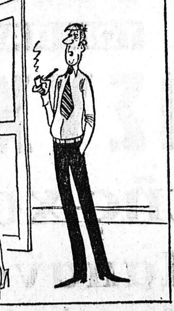
—Θελεεις να φορησες «κάτι» ντερι—αίζον: "Ε, θαλε ένα βερνύ κορουά καί μία χειμερινη φούδα ή το ανάδοσο...

ρά τους κινδύνους, τους οποίους συνειληγότο. Έληγομενοσιν διε ή άραχημένη τον ελεην ύποκομητή την άδουνοσάνην, διά γα ή συνουδότη τον Γεωργίον — Λουδοβίκον, οίος του πρόσφατον πολιτικόν ταξιδίον του εις το Βερολίον, οίος άσσε γα δινηθη καί τού χορήγη νίκας άρατον έρωτικής έντιχίας, οει ελεην επίσης ύποκομητή εις καθήμενας μαλίες άπο του ταυού της Αλφης, διά να θεραπειηθή εκ της δλην άδουνοσάνης, οει εις ελεην σχεδόν άδουνοσάνη πραγματικώς εκ της θεραπειουτικής άνογης, που ελεην άρσθη άπο του αλλικού Ασκληπιουδου. Πάσα ού νεις καί λογική τον ελεχ εγκυκαλίωσιν!