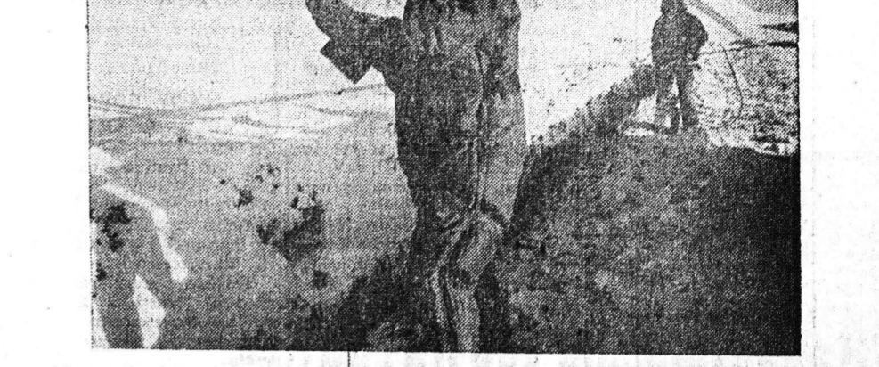
Προχωρούν οι έργασίες της Μπρίτις Πετρόλεουμ στην Άλάσκα γιά τήν έγκατάσταση τού άγωγού πού θα μεταφέρει άκατάργητο πετρέλαιο στό λιμάνι Βαλντέζ με ρυθμό 1.500 εκ. βαρέλια τή μέρα