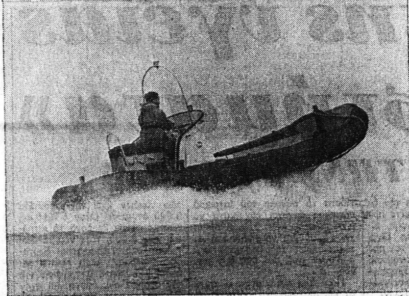
ΑΡΙΣΤΕΡΑ: Το πρώτο στον κόσμο φουσκωτό διζελονηινό σκάφος κατασκευασμένο από την αγγλική εταιρεία Ντράιβινγκ... ΔΕΞΙΑ: Στο Γκρογκουίτς της Αγγλίας το ειδικό ιαχούττα 25 κόβων και είναι κατάλληλο για σωστικές επιχειρήσεις...