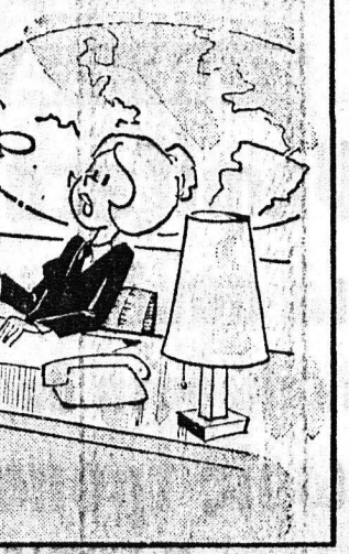
Τοπίσκον παρακάτω με ελαφρηγήτην να κίμετρ σφ- Εση... του ένδοφρονότος σας για μένα!