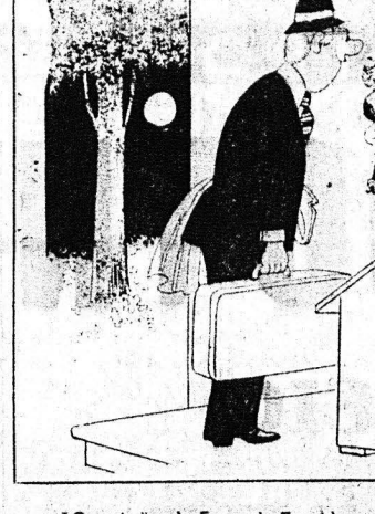
Ω, τί έκκληεις, ανδρούλη μου! Δεν σε περιμένα ακόμη και πως φοβόμουν μονάχη...

Ο ΔΙΟΓΗΣ ΤΗΣ ΗΜΕΡΑΣ ΑΘΗΝΟΓΕΝΟΥΣ ΓΕΡΟΜΑΤΥΡΟΣ ΕΠΙΣΚΟΠΟΥ ΠΗΛΑΔΑΧΘΗΣ