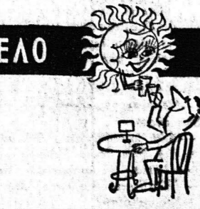
Επιμέλεια ΘΑΝΑΣΗ ΓΚΟΒΑ