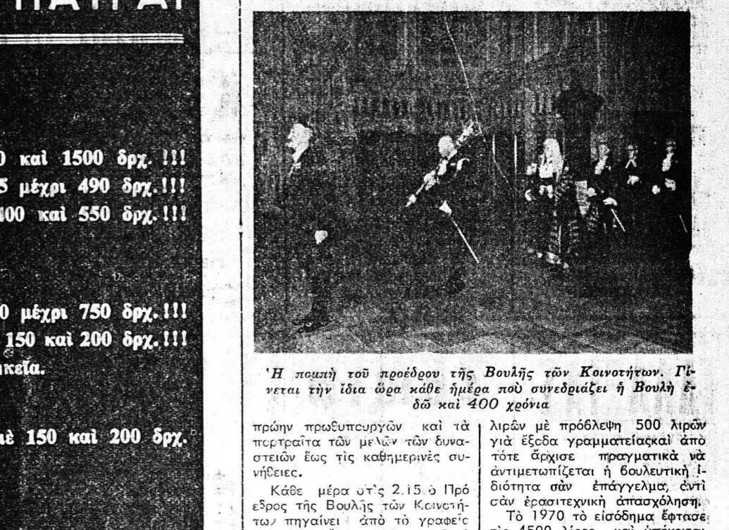
'Η ποιητή τού πρόεδρου τής Βουλής των Κοινοτήτων. Γι...