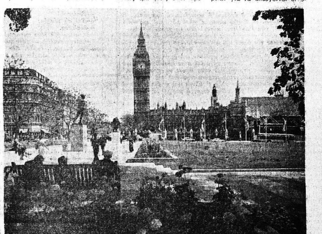
'Η πλατεία τού Κοινοβουλίου. Στόν Πύργο τής Βουλής τού περίφημο σούλι 'Μπικ Μπέν...