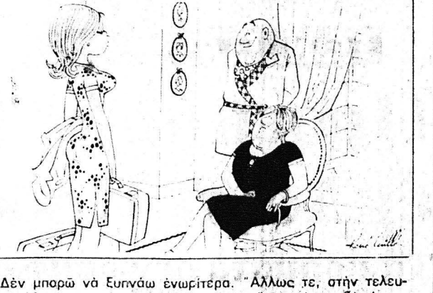
—Δέν μιλάει με Ευρώπη ενωριότερα. Άλλως τε, στην τελευ- ταια βεση μου, μου έβρισαν το πρινοί στο κρεβάτι!..