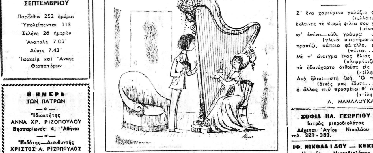
—Θά μπορούσα να οδός ακούω ύπνος και ύπνος, αλλά...θά χρώμα το τελευταίο λευκώρει!