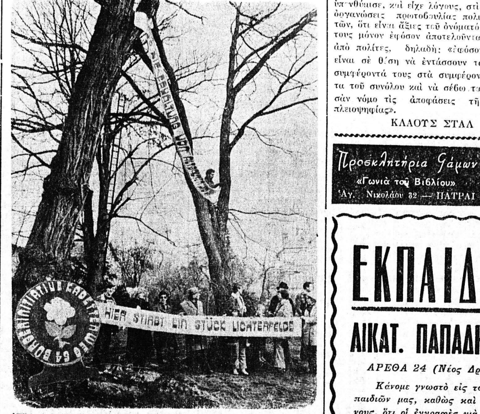
Έδω πεθαίνει ένα κομμάτι του λιχτηρφέλτε» γράφει στην ταβία του σωματείου πρωτοβουλίας πολιτών του Καντεντενχεν στο Δυτικό Βερολίνο. Αυτοί οι άνθρωποι, γυναίκες και παιδιά δεν θέλουν να ξεριζωθούν τα πολυτήρια αυτά, πολλών χρόνων δέντρων, πέφτοντας θύματα της ανεγέρσεως ενός μοντέρνου οικισμού. Άνευθύνου εκκλησία προς την γεροφυρία του Βερολίνου να δέσεται αν είναι νόμιμο το επικείμενο ξεριζώμα των δέντρων αυτών.

ΜΟΝΑΧΟ. — Κάθε δημοκρατική πολιτική διακρίνεται στην άσκηση των δημοκρατικών θεσμών, δηλαδή τελειώνει στο Μόναχο ή Βάλτερ Σέλ. Έν, η οποία της άσκησης του θεσμού θεοδότησε Χόις σε πολλές και οργανώσεις πολιτών, πολιτικών, στρατιωτικών, εργατικών, φοιτητικών, κλπ. Η άσκηση της δημοκρατίας είναι η βάση της δημοκρατίας. Στραφείς προς τη διεκδίκηση πολιτικών της Όμοσπονδίας, των όμοσπονδίων χωρών, των δήμων και κοινοτήτων ή πρόεδρος της Όμοσπονδίας