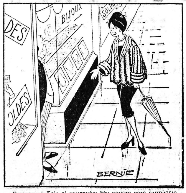
—Περιεργονί Σείσι οι χριστοόχοι δεν κάνουνε ποτέ εκπώσεις...

Η ΗΜΕΡΑ ΤΩΝ ΠΑΤΡΩΝ — Ο — Ιδιοκτήτης ΑΝΝΑ ΧΡ. ΡΙΖΟΠΟΥΛΟΥ Ψαρραίων 4, Αθήναι — Ο — Εκδότης—Διευθυντής ΧΡΗΣΤΟΣ Α. ΡΙΖΟΠΟΥΛΟΣ Τσαμαδού 47 — Ο — Αρχισυντάκτης ΝΙΚΟΣ ΠΟΛΙΤΗΣ Φιλομαρτίου 18 — Ο — Προϊστάμενος Γραφείου—Υπογραφέων ΧΡΗΣΤΟΣ ΑΘΑΝΑΣΙΟΥ Φιλικών 2