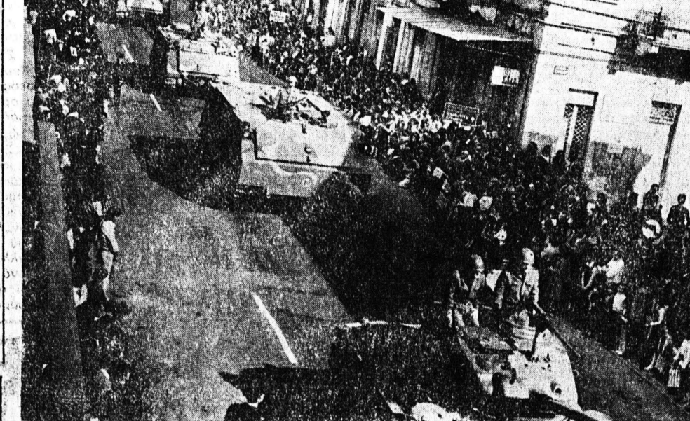
'Επιβλητική όπως πάντα ήταν στην παρέρηση η εμφάνιση των μηχανοκίνητων και πεζοπό- ρων τμημάτων των 'Ενόπλων Δυνάμεων

διαμνημόνευτος για τό γνωστό έξιμα τού καταρτίσιμου τού επι- μου πρωτοκόλλου