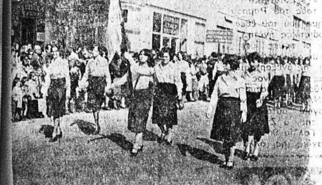
Η σημαία τού Β' Λυκείου θηλείου.

Στις 8.30 τή πρωή έγινε έ- επείο της Σημείας στό Φρού- τιές έπέδωσε διευρία πρωιτών τού ΚΕΤΧ.