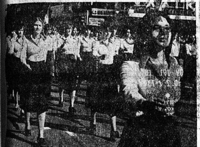
Τά σχολεία της Μέσης 'Εκπαίδευσης παρουσίασαν στην πα- ρέρηση τμήματα μαθητών και μαθητριών που έδαμύτησαν για τό ώραίο παρέρημα των