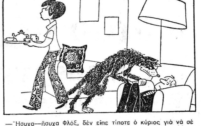
—Πούγα—Πούγα Φλας, δεν είπες τίποτε ο κύριος για να σε βίει!

ΠΑΡΑΣΚΕΥΗ 30 ΔΕΚΕΜΒΡΙΟΥ Παρήλθον 364 ημέραι Υπόλοιποι 1 Σελήνη 20 ημερών