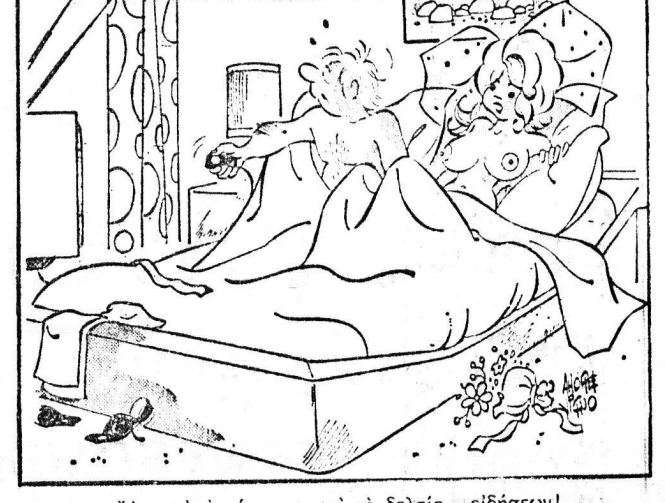
— Άσ' ν' ακούσουμε και τ' δελτίο ειδήσεων!