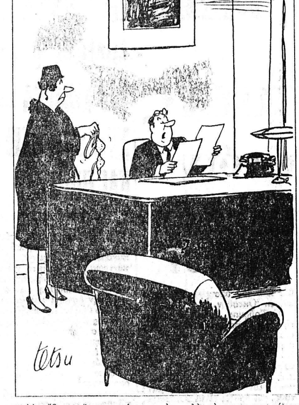
Δεν ηβρες ότι σταμάτησα την συλλογή γραμματσημα...