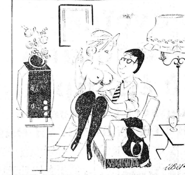
—Σας υπενθυμίζω ότι υποχωρώ μόνον επειδή η τηλεόραση έχει χαλάσει...

ΚΥΡΙΑΚΗ 7 ΜΑΪΟΥ Παρθένου 127 ήμεροι Υπολείπονται 238 Νέα Σελήνη 'Ανατολή 6.23' Δύση 8.21' Τού Θωμά 'Ακακίου, Κορδαίου, Μαξιμου μαρτύρων