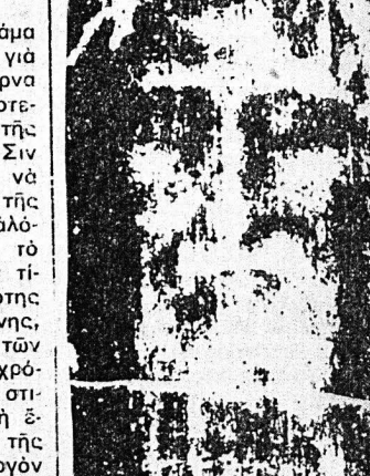
'Η μορφή τού 'Ιησού όπως έμφανίζεται στό άποτύπωμα τής Σινδόννης

«Μία άλλη άντίρρηση, ή όποία διετυπώθη μετά τήν προβολή τής ταινίας «Σιωπηρός Μάρτυς»...»