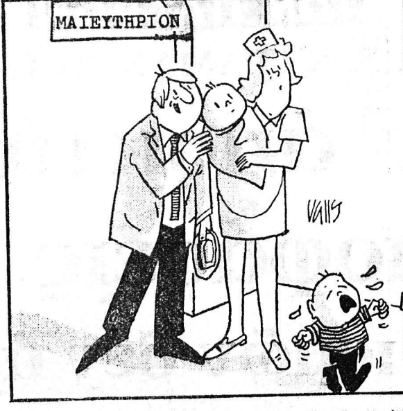
ΜΑΙΕΥΤΗΡΙΟΝ... "Απογοητευμένη! "Ηθελε να το φέρο, ένα ζευγάρι πατρίνα!"