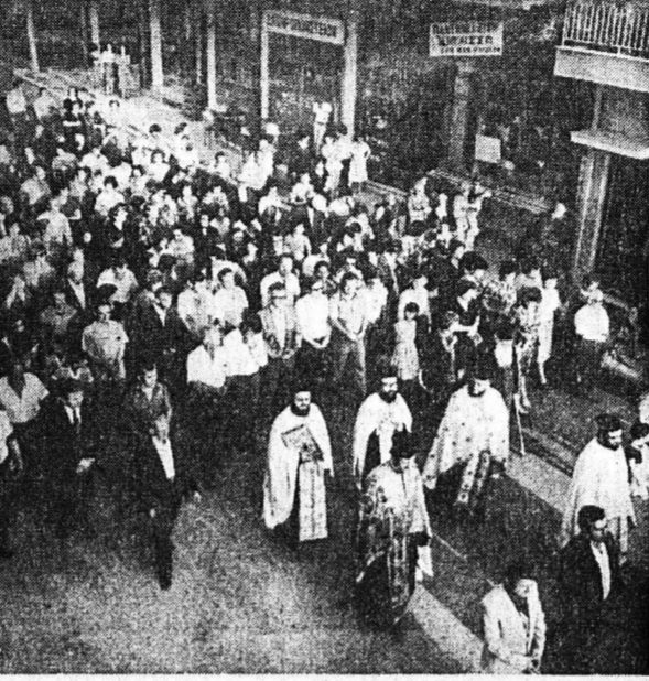
Την περασμένη Δευτέρα, στον ναό 'Αγίας Τριάδος Ζαρουχλεϊκών ετελέσθη πανηγυρική λειτουργία και ετηκολούθησε περιφορά της Εικόνας στας όδους της συνοικίας.