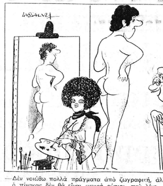
—Δεν νοιώθω πολλά πράγματα από ζωγραφική, αλλά αυτός ο πίνακας δεν θα είναι ενεκρή φύσις, που λένε...

Η ΗΜΕΡΑ ΤΩΝ ΠΑΤΡΩΝ — "Ιδιοκτήτης ΑΝΝΑ ΧΡ. ΡΙΖΟΠΟΥΛΟΥ Βρασειάνος 4, "Αθήναι — "Εκδότης — Διευθυντής ΧΡΗΣΤΟΣ Α. ΡΙΖΟΠΟΥΛΟΣ Τσαμαδού 47 — "Αρχισυντάκτης ΝΙΚΟΣ ΠΟΛΙΤΗΣ Φιλοποιήσις 18 — Προϊστάμενος Γραφείων — Υπογραφέων ΧΡΗΣΤΟΣ ΑΘΑΝΑΣΙΟΥ Φιλικών 2