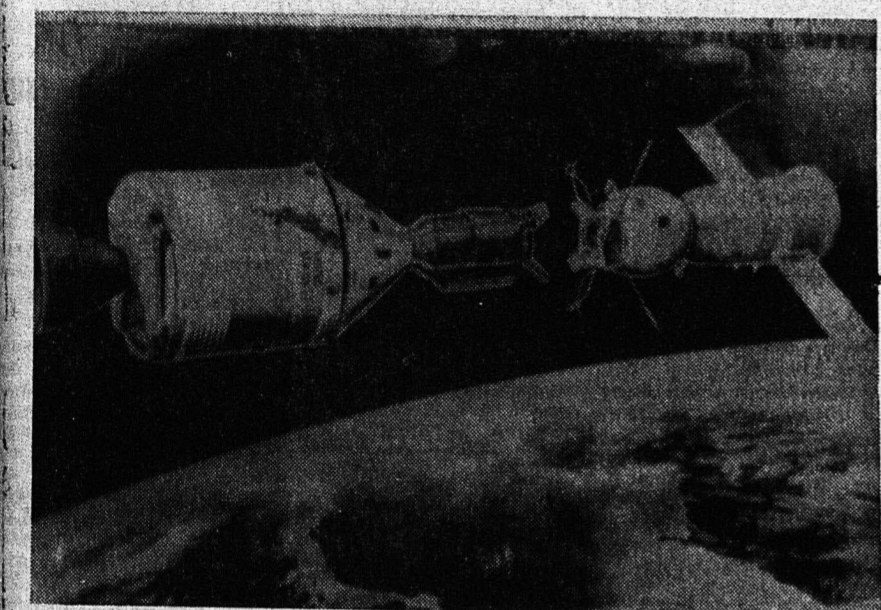
Άνωτέρω τα διαστημόπλοια της πτήσεως «Απώλλων - Σογιούζ» Σχέδον Δοκίμαζ' πριν της συνδέσεώς των. Αριστερά το δε διαστημόπλοιον Απώλλων με τα τμήματά του κατά σειράν και δεξιά το διαστημόπλοιο Σογιούζ με τα τμήματά του.