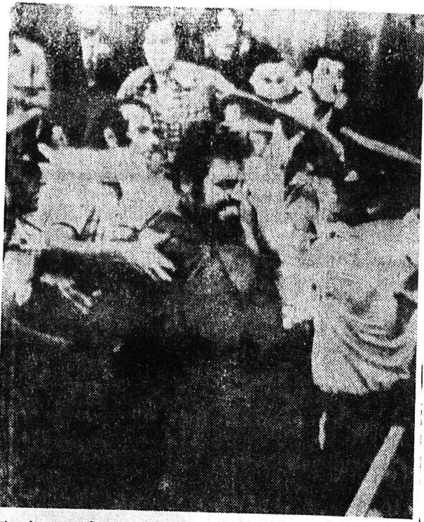
ΕΙΣ ΗΛΕΚΤΡΙΣΜΕΝΗΝ ΑΤΜΟΣΦΑΙΡΑΝ ΣΥΝΕΧΙΖΕΤΑΙ ΕΝΩΠΙΟΝ ΤΟΥ ΔΙΟΙΚΗΤΙΚΟΥ ΣΤΡΑΤΟΔΕΙΚΤΕΩΣ ΑΘΗΝΩΝ Η ΔΙΚΗ ΤΩΝ 32 ΣΤΡΑΤΟΠΟΙΤΩΝ ΤΟΥ ΕΙΔΙΚΟΥ ΑΝΑΓΚΑΣΤΙΚΟΥ Τμήματος (ΕΑΤ)...