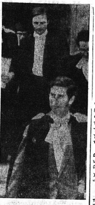
Ο δόξαρχος του Βρετανικού θρόνου, πρίγκηψ Κάρολος μεταβάζει εις Πάτρας.

Το θέμα της κατασκευής αεροδρομίου εις Πατρας προεβλεπόταν. Θα ήτο δυνατόν να γινεί επί λαμβάνειν σάρκα επί σόσσι αλλά επειδή ευρίσκονται εστί εις την φάση μελετών θα γρήγορα μίαν μόνον επιφύλαξιν.