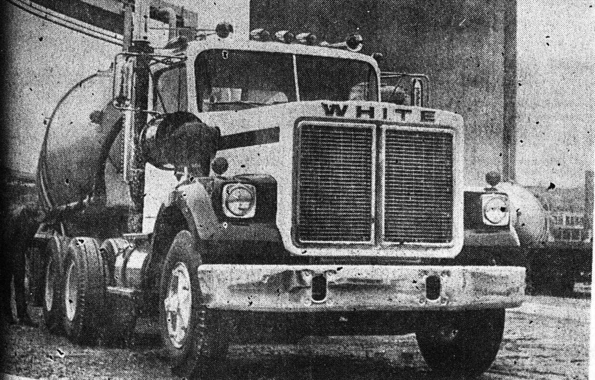
Κ. ΚΑΣΙΔΟΠΟΥΛΟΣ Α.Ε.

ΚΗΦΙΣΟΥ 168, ΠΕΡΙΣΤΕΡΙ, ΤΗΛ. 59 00.616 και 59 04.222 (7 ΓΡΑΜ.) ΑΘΗΝΑΙ