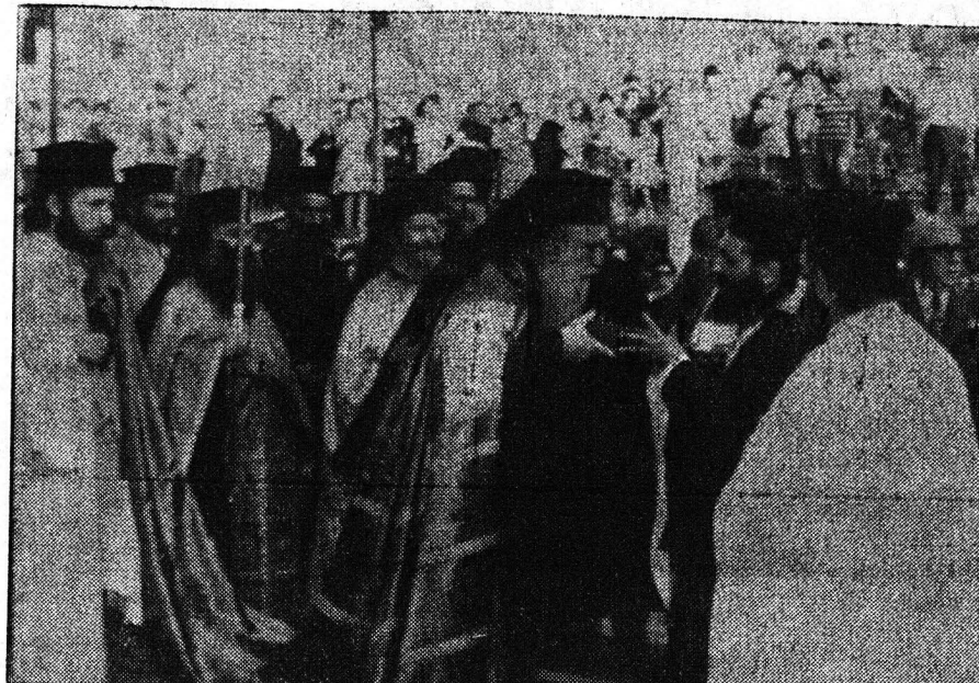
Στιγμιότυπο από την λαβύρινθο των παρελθόντων Σαββάτων πανηγυρικών και ενδοστράτων τελετών...