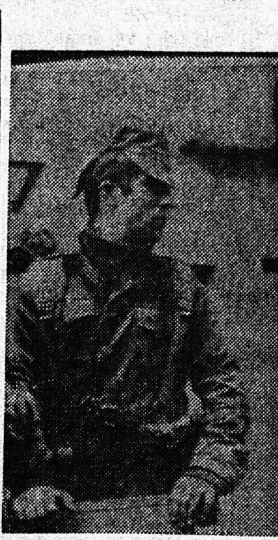
Οι στρατιώτες στην Πορτογαλία είναι κατά το ήμισυ πολιτικοί...