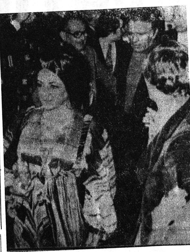
...εν τω σέξ αν μέσον γιά να ανακουφιστεί κάπως από τις πολλά ρίθμες σωματικές και ψυχικές του ταλαιπωρίες».

ΚΟΝΕΓΧΑΓΗ. «...εν τω σέξ αν μέσον γιά να ανακουφιστεί κάπως από τις πολλά ρίθμες σωματικές και ψυχικές του ταλαιπω- ρίες».