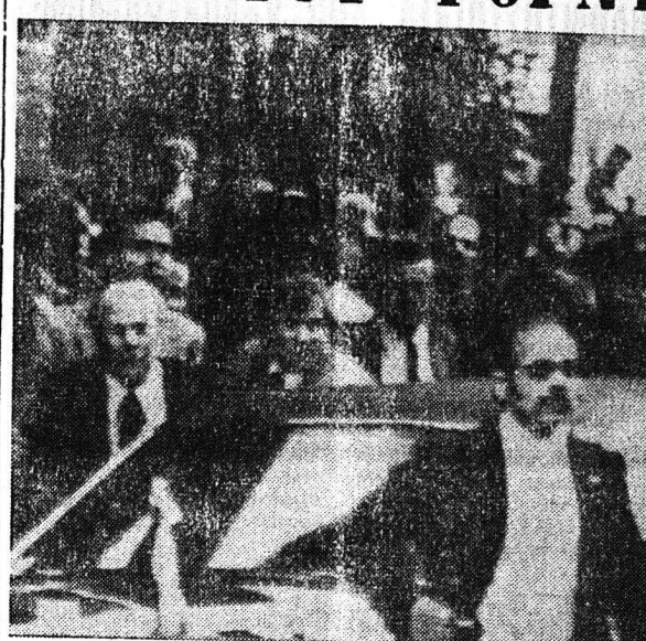
Διά δευτέραν φοράν έντός 150ημέρου ή ζωή του Προέδρου τού: Ηναγόμενος Πολιτείας κ. Τζεραλό Φορβ, έντεθ ήν κινδύνω, συνεπέσιν Βολοφών κ.κ. άποπειράσ έννομιον τού...