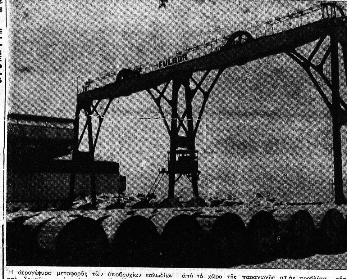
Η αερόγειο μεταφορά των υποβρυχίων καλωδίων από το χώρο της παραγωγής στην προβλήτα της FULGOR στο Σουσακί, προς φόρτωση στο ειδικό πλοίο παντοειχών υποβρυχίων καλωδίων «ΚΕΡΑΥΝΟΣ».

Επιχειρηματίας γίνεσαι διότι... Είς την θαλασσινή αυτήν... Επί του παρόντος... Το 1969 η FULGOR... σύμφωνα με την κρατική