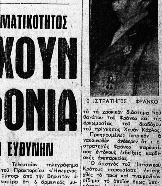
Ο ΣΤΡΑΤΗΓΟΣ ΦΡΑΝΚΟ