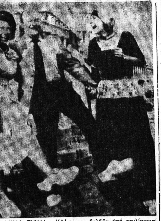
ΟΛΛΑΝΔΙΚΑΙ ΕΥΧΑΙ ΚΑΙ ΕΥΛΟΠΟΥΤΣΑ

Με 100 δραχμές απολαύατε τού Hilton και τού Moreas