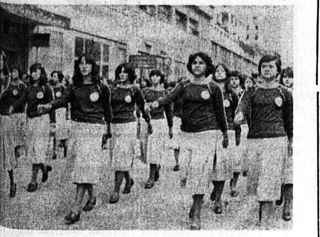
Μαθήτριά της πόλεως εις την παρέλασιν

Στιγμιότυπον από την ώρα αν παρέλασιν επί τη επέτειο της 28 Οκτωβρίου. Είς προωθημένη θέσιν ο Υπουργός Προεδρίας κ. Κ. Στεφανόπουλος και όπισθεν, εξ άριστερών ο Νομάρχης κ. Ν. Χανός, οι βουλευταί κ.κ. Ν. Βγενόπουλος και Ν. Πατρώνης, ο Σεβασμιώτατος Μητροπολίτης κ Νικοδήμος (καθήμενοι και μη διακρινόμενοι) και ο Ανώτερος Διοικητής Φρουράς Πατρών, ταξιαρχος κ. Αλ. Κορδάτος.