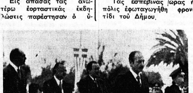
Είς απάσας τας ανωτέρω εορταστικάς εκδηλώσεις παρέστησαν ο Υπουργός Προεδρίας Κυβερνήσεως κ. Κ. Στεφανόπουλος, ο Νομάρχης κ. Ν. Χανός, οι βουλευταί κ.κ. Ν. Πατρώνης και Ν. Βγενόπουλος, ο Διοικητής Φρουράς Πατρών ταξιαρχος κ. Αλ. Κορδάτος και αι λοιπαί πολιτικά και στρατιωτικά άρχαι και πλήθος κόσμου.