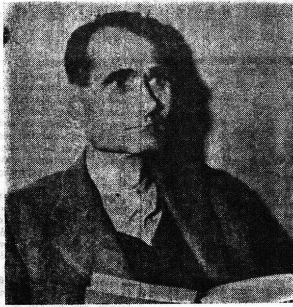
Ο 4 ΡΟΥΝΤΟΛΦ ΕΣΣ

Η άπαιτη και σκοτεινή περιπέτεια του Ρούντολφ Έσς, που θέλησε να σταματήσει τον Β΄ Παγκόσμιο Πόλεμο, για να σώσει την λευκή φυλή. Είναι η τελευταία εικόνα του πολέμου που δεν διαφέρει από τις άλλες. Μια τραγική και τρελή εικόνα. Ζεί στο εξοριστικό τριαντάκι εκτός κελί μιας φυλακής, που όλα τ' άλλα κελιά της είναι άδειασμα. Είναι ένας άποιαρκομένος γέρος 83 χρόνων, που, όπως λέει η οικογένειά του υποφέρει από καρκίνο του προστάτου κι' άργαστείνει, κάτω από την άγρυπνη επίβλεψη εξήντα δευμοφύλων και στρατιωτών τσα σαρών χωρών. Το όνομα αυτού του γέροντος ζει μόνο για την Ιστορία. Μεταξύ εκείνων που γεννήθηκαν κατά η με τον πόλεμο, ελάχιστοι θυμούνται το όνομα Ρούντολφ Έσς. Ελάχιστοι γνωρίζουν την ιστορία του καταδικάσει του εξορισμού του ηρώου αυτού του φυλακής Ζπανιού του Βερολίνου.