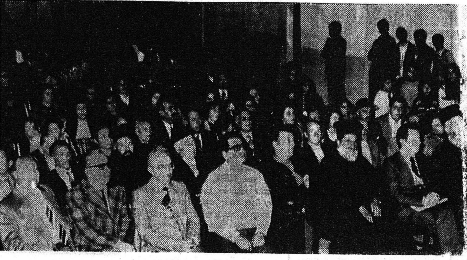
ΜΙΑ ΕΙΚΩΝ ΑΠΟ ΤΗΝ ΣΥΓΚΕΝΤΡΩΣΙΝ ΕΙΣ Κ. ΑΧΑΪΑΝ