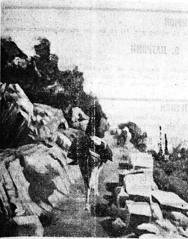
Έργον του Τζανή Αλιφέρη, του γνωστού Τζάλ.