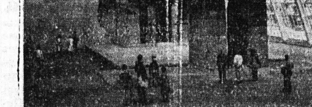
Η ΣΩΤΗΡΙΑ ΕΝΟΣ ΜΝΗΜΕΙΟΥ

την κατασκευή όποια θα αρχίσουν τον έργο τον Ιούνιο και θα διαρκέσει τέσσερα χρόνια. Οι Δυτικογερμανοί διπλωμάτες πιστεύουν ότι η Σοβ. Ένωση έχει δώσει την συγκατάθεσή της πρό της συνάψεως των συμφωνιών. Η έγκρισή αυτή λέγεται, έγινε μόνον μετά την επίσκεψη του Σοβιετικού ηγέτου Λεονίντ Μπρέζνιεφ στη Δ. Γερμανία την περασμένη άνοιξη. Επί πλέον, η Σοβ. Ένωση διόρισε ένα ανώτατο διπλωμάτη της, που είναι εκπαιδευτής μέλος της Κεντρικής Επιτροπής του Κόμματος ως πρεσβευτή στην Βόννη. Επίσης πολύ σημαντικό είναι το γεγονός, ότι η Μόσχα έδωσε σήμα στο Δ. Ανατ. Βερολίνο να προχωρήσει σε συμφωνίες με την Βόννη. Η Σοβ. Ένωση βλέπει πάντοτε με καχυποψία κάθε ένδοξο συνεννόηση κάποιων σημείων μεταξύ των δύο Γερμανιών που φερόταν ότι γίνεται εις βάρος της. Στην Δ. Γερμανία οι συζητήσεις περί των νέων συμφωνιών με την Ανατολική Γερμανία, συνοδεύονται από αίτημα των Συμμάχων—και μία όχι πρόσθυμη υπόσχεση της Δυτ. Γερμανίας—να κατασταλή το λαθρεμπόριο Ανατολικογερμανών φυγάδων που μετρήθηκαν Δυτικογερμανοί πολίτες στις επί του αυτοκινητοδρόμου μεταξύ Δυτ. Βερολίνου — Δ. Γερμανίας οδούς διελύσεως προς την Ανατ. Γερμανία.